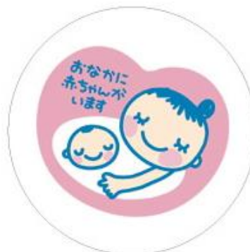
マタニティマーク