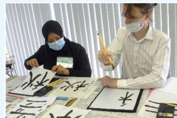
Aprende divertido-se com atividades de cultura tradicional japonesa