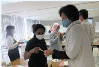
Pratique com os assistentes voluntários