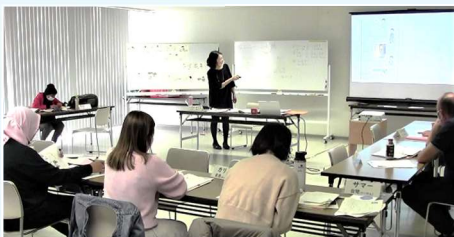
As aulas serão dadas por professores qualificados!