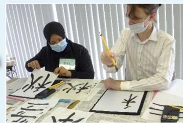
课程采用游戏和 日本文化活动!