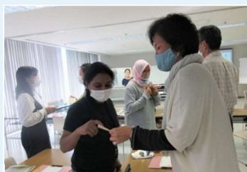
一起练习日语会话的志愿者