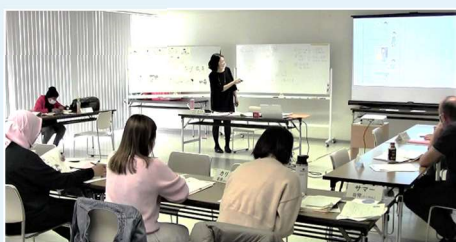
老师持有日语教师证!