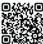
ちゅうごくご 中国語