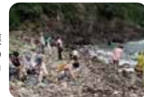
(隠岐の島の観察会)

【時間】10:00~12:00 【会場】ラン①(国際会議場地下2階) 【内容】南米アマゾン自然保護区、奄美群島、隠岐の島の自然を訪ね、エコ・ツーリズムの在り方を考えます。 【新日本ガラバゴス研究会】