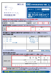
【1】 formulario de solicitud