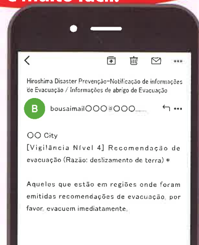
* O texto do e-mail é uma imagem e é diferente do texto real.

✉ Conteúdo de notificação do serviço de aviso por e-mail das informações de prevenção de desastres de Hiroshima (Somente itens necessários)