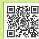
Código bidimensional para smartphone

Todos Juntos Divisão de Promoção da Redução de Desastres, da Supervisão de Gerenciamento de Crise de Hiroshima TEL.: 082-513-2781